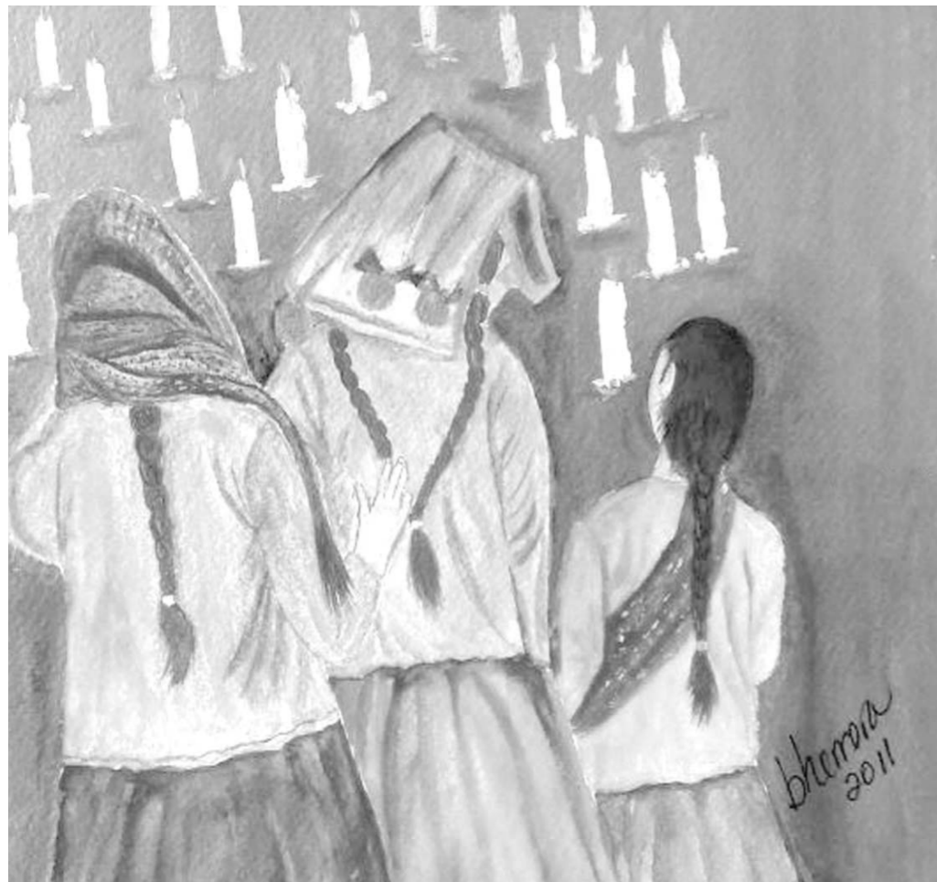
"Celebración" por Beatriz Herrera

De En voz desmayada y baja - Ed. Vinciguerra, 2009