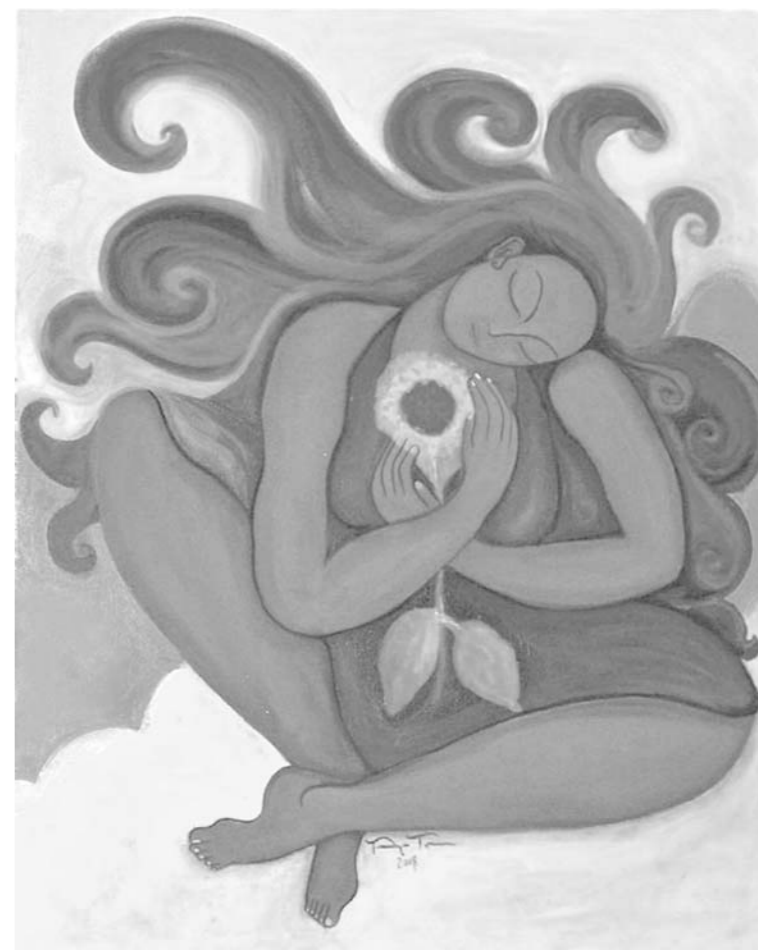
"Pelo azul", por Tanya Torres